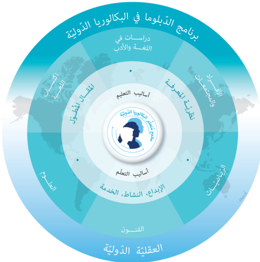
نموذج برنامج الدبلوما